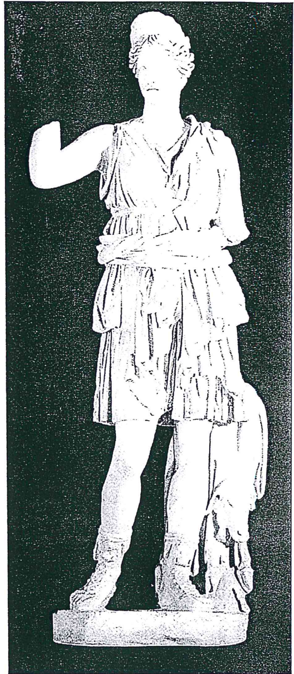
Εικ. 1. Άγαλμα Αρτέμιδος από το θέατρο της πόλης Italica της Ισπανίας. Ρωμαϊκό αντίγραφο. Έργο σε παριανό μάρμαρο. Αρχαιολογικό Μουσείο Σεβίλλης (Φωτογραφία: R. C. Sanchez, Las Ruinas de Italica , 11).

Η επικράτηση του Χριστιανισμού και η φθίνουσα επιρροή της εθνικής θρησκείας δημιουργεί αρνητικές προϋποθέσεις για τη ζήτηση του μαρμάρου και κατ' επέκταση για την οικονομία της Πάρου που ήταν συνδεδεμένη μ' αυτό. Το γεγονός ότι η νέα θρησκεία τείνει